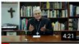
En Línea con el Pastor 17 de mayo de 2020 66 vistas · Hace 1 semana

4. Conferencia de Monseñor Fabio Suescún, sobre la vida en tiempos de Covid-19, dirigida a los alumnos de la Escuela de Suboficiales de la Fuerza Aérea Colombiana, a través de la plataforma virtual Teams de Office 365.