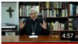
Feliz Día del Maestro 98 vistas · Hace 1 semana