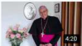
Feliz Día de la Madre 82 vistas · Hace 2 semanas

5. Las plataformas virtuales y las redes sociales se han convertido en el medio más efectivo para continuar acompañando espiritualmente al personal del Sector Defensa y sus familias, es por eso que Monseñor Fabio Suescún Mutis a través del Canal de Youtube “Obispado Castrense de Colombia” Facebook: Obispado Castrense de Colombia, Instagram y Twitter @obiscastrense, envía semanalmente el mensaje de En Línea con el Pastor y mensajes dirigido a nuestras Fuerzas Armadas, invitando a tener fe, esperanza y fortaleza.