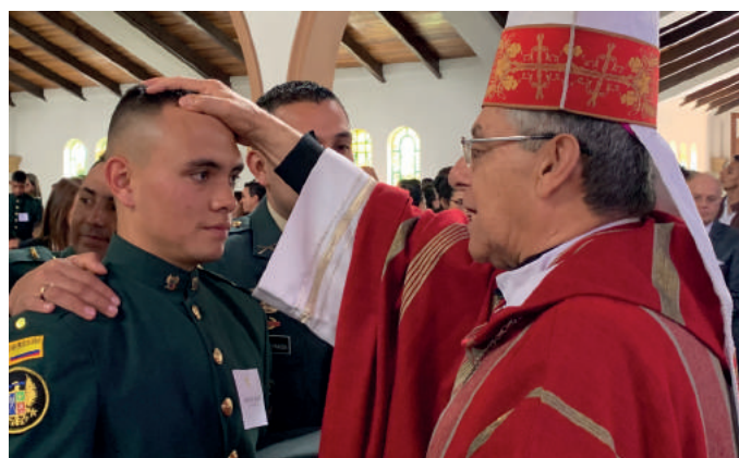
Confirmaciones a 138 cadetes en la Escuela de Cadetes José María Cordova