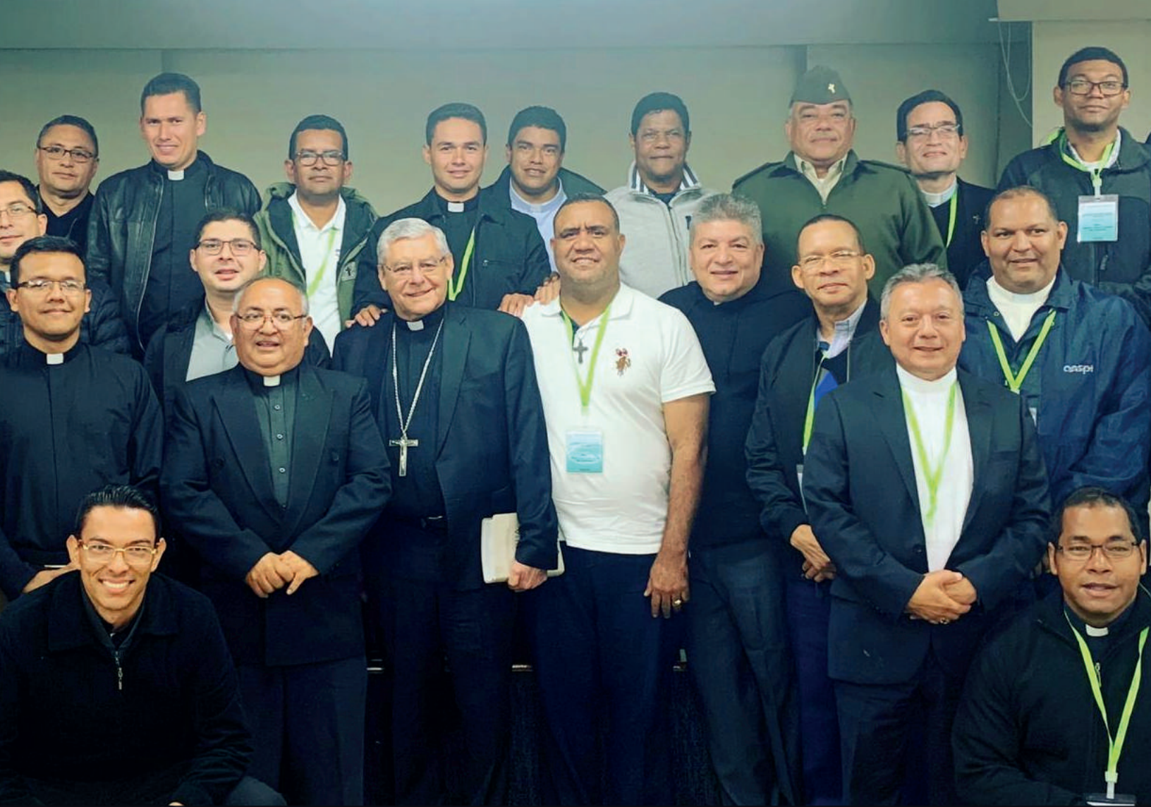
Seminario de Pastoral Castrense organizado por el Consejo Episcopal Latinoamericano-CELAM.