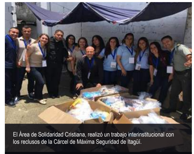
El Área de Solidaridad Cristiana, realizó un trabajo interinstitucional con los reclusos de la Cárcel de Máxima Seguridad de Itagüí.