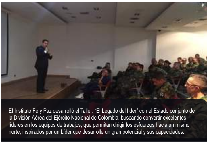
El Instituto Fe y Paz desarrolló el Taller: "El Legado del líder" con el Estado conjunto de la División Aérea del Ejército Nacional de Colombia, buscando convertir excelentes líderes en los equipos de trabajos, que permitan dirigir los esfuerzos hacia un mismo norte, inspirados por un Líder que desarrolle un gran potencial y sus capacidades.