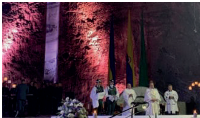
En una solemne Eucaristía, Monseñor Fabio Suescún, Obispo Castrense de Colombia, Monseñor Jorge Hincapié Henao, Vicario General y el Capellán General del Ejército Nacional, Presbítero Héctor Pongutá, realizaron la entronización de la Virgen del Soldado en la Catedral de Sal en Zipaquirá, con la asistencia de oficiales y suboficiales del Ejército Nacional y la Fuerza Aérea. #HéroesBicentenario