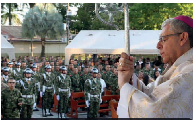
Monseñor Fabio Suescún Mutis, visitó y realizó el fortalecimiento espiritual en el Fuerte Militar de Larandia Caquetá, en una sagrada eucaristía con nuestros militares Héroes Bicentenarios. #SomosObispadoCastrense