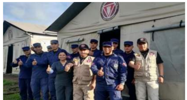
El Área de Solidaridad Cristiana, continúa con el ciclo de talleres desde las unidades militares y policiales de Antioquia, con el Taller "Relaciones Interpersonales".