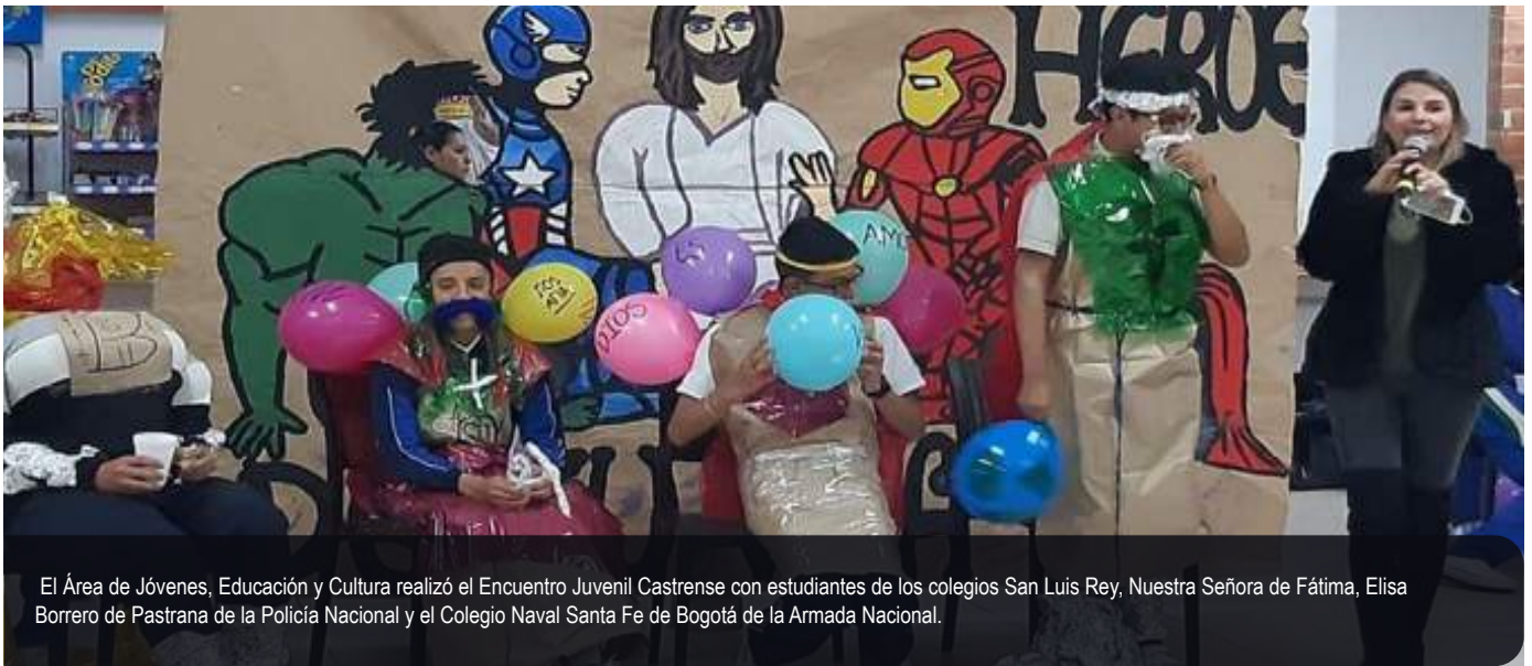
El Área de Jóvenes, Educación y Cultura realizó el Encuentro Juvenil Castrense con estudiantes de los colegios San Luis Rey, Nuestra Señora de Fátima, Elisa Borrero de Pastrana de la Policía Nacional y el Colegio Naval Santa Fe de Bogotá de la Armada Nacional.