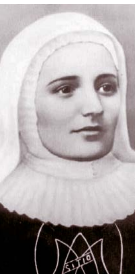
Santa Laura Montoya