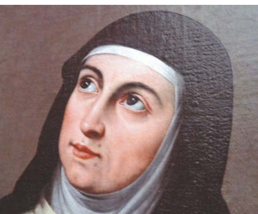
Santa Teresa de Ávila

G randes mujeres y Santas han dejado mella en la historia, ellas proyectan con sus dones de fortaleza y entrega, que es posible triunfar sin dejar de lado lo esencial de ser mujer y a la vez sin perder su rol de generadora de vida en la sociedad. Estas mujeres se pueden definir con tres simples pero profundas palabras: Amor, pequeñez y Apóstol; Santa Teresa de Ávila, Santa Teresita del niño Jesús y Santa Laura Montoya respectivamente son mujeres que fueron escogidas por Dios para glorificarlo mediante su entrega y sacrificio, cada una de ellas con un carisma y dones otorgados de una manera diferente pero que se complementan en el rol de la mujer en la actualidad.